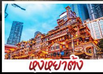
แสงภูเขาตั้ง