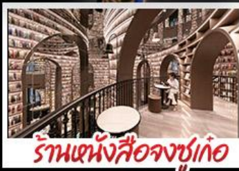
ร้านหนังสือจุงชู่เก้อ