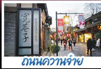
ถนนชุนซีลู่