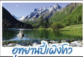
อุทยานปักเฉิงโกว

ภูเขาสี่ฤดู อุทยานจิวจ้ายโกว นั่งรถไฟความเร็วสูง น้ำพุไม้ไฟตึกSKP อุทยานปักเฉิงโกว วัดต้าฉือ ถนนโบราณชอยกวางชอยแคบ ช้อปปิ้งถนนไถ่กู่หลี่ + ถนนชุนซีลู่