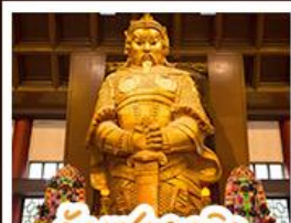
วัดเชกงเมว