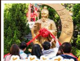
วัดเซ่งต้าเซ็ง