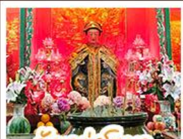
วัดเล่งโงเมว

นึ่งรถรางฟ้าดีแถมสู่ TOP OF PEAK • ช้อปปิ้งจูงมก และ CITYGATE OUTLAETS • นึ่งกระชานองปิง สักการะพระใหญ่เทียนถาน • จอพรเจ้าแม่หล่งโหมว แมงอง 5 มังกร ให้ประสบความสำเร็จในทุกๆ ค้าน