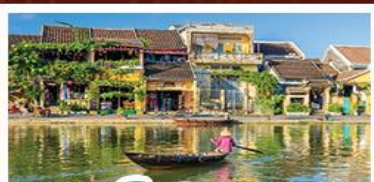
เมืองโบราณเฮงฮัน

! พักบนเขานาฮิลล์ 1 คืน ! สัมผัสอากาศเย็นตลอดปี สตรีตฟรังเศสสุดคลาสสิก - นั่งกระเช้ายาวที่สุด สู่มานาฮิลล์ สนุกสุดมันส์ไปกับสวนสนุก The Fantasy Park นมัสการเจ้าแม่กวนอิมองค์ใหญ่ที่สุดของเมืองดานัง - เช็กอินเมืองมรดกโลกฮอยอัน - สนุกสนานไปกับกิจกรรม!!นั่งเรือกระดิง หมู่บ้านกัมถาน เช็กอินร้านกาแฟ SON TRA MARINA CAFE - ไม่หลงร้านช้อปปิ้ง - อิ่มอร่อยกับบุฟเฟ่ต์นานาชาติ , หม้อไฟซีฟู้ด