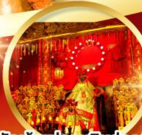
วัดเจ้าแม่กวนอิมฮ้องอำ