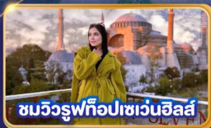
ชมวิวยุฟทือปเซเวนฮิลส์