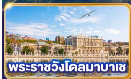
พระราชวังโดลมาบาซ