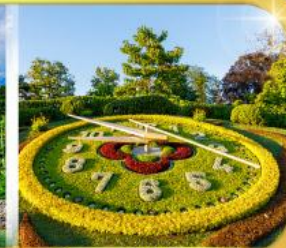
นาฬิกาดอกไม้เมืองเจนีวา