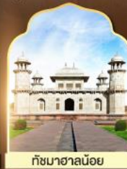
ทัชมาฮาลน้อย