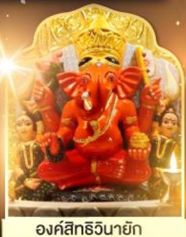
องค์สิทธีวินายก