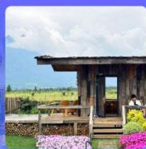
ร้านอาหารพหุยนต์อัน