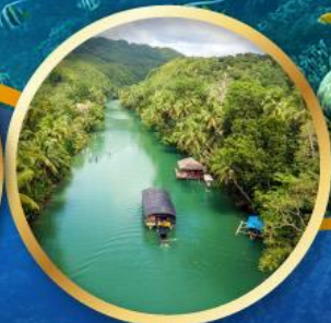
ล่องเรือแม่น้ำโลบ็อก