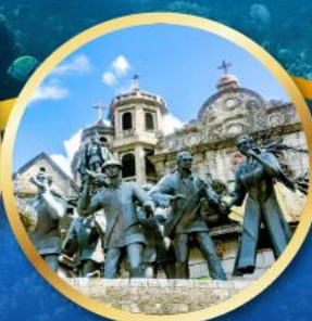
อนุสาวรีย์มรดกแห่งเซบู