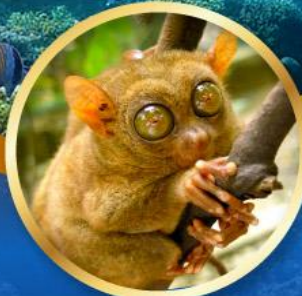
ลิงทาร์เซีย