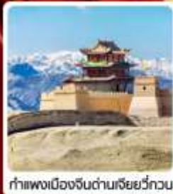
กำแพงเมืองจีนด่านเสียวี่กวน

• ไซโล...เส้นทางสายไหม ชมสระบัววังพระจันทร์ ทะเลทรายหิมิงซาซาน กำแพงเมืองจีนด่านสุดท้าย "เจียยี่กวน" มรดกโลกภูเขาสายรุ้งจางเย่