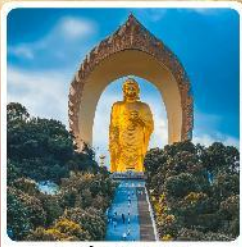
พระใหญ่ตงหลิน