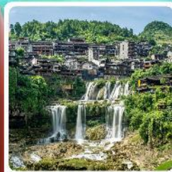
ฝูหลงเจิน