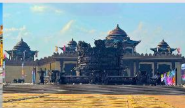
ศูนย์วัฒนธรรมหยวนหยิว