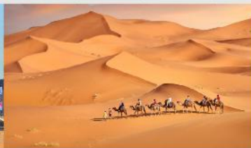
ทะเลทรายเสี่ยงชวาน