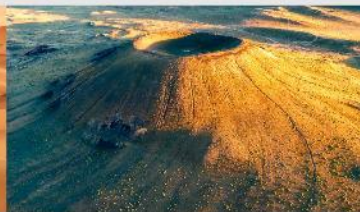
ภูเขาไฟอูลันฮาตา

*ทางบริษัทฯ ขอสงวนสิทธิ์ในการสลับโปรแกรมทัวร์ตามความเหมาะสมขึ้นอยู่กับสถานการณ์หน้างาน โดยคำนึงถึงผลประโยชน์ของลูกค้าเป็นสำคัญ