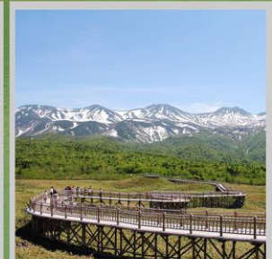
"SHIRETOKO 5 LAKES"