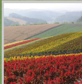
"SHIKISAI NO OKA"