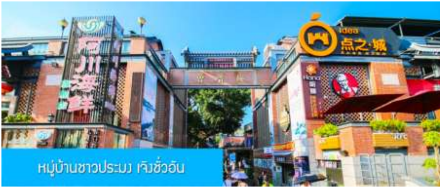
หมู่บ้านชาวประมง เจิวโจ้วอัน