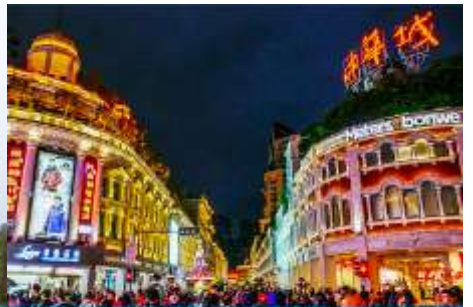
ถนนคนเดิน จวซาลู่