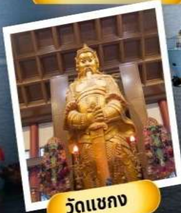
วัดเขากง