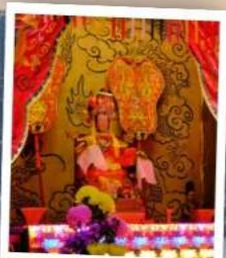
เจ้าแม่กวนอิม จอสมเอิร์ลเบย์