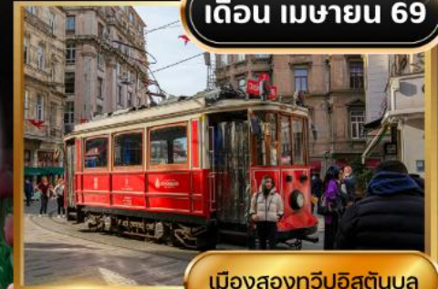
เมืองสองทวีปอิสตันบูล