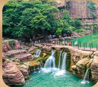
“อุทยานหยุนไท่ซาน”

ชมถ้ำหลงเหมิน มรดกโลกที่เมืองลั่วหยาง • สุสานจีนซีฮ่องเต้ • ศาลเจ้ากวนอู วัดเส้าหลิน + ป่าเจดีย์ + ชมโชว์กังฟู • เมืองโบราณลั่วหยาง • อุทยานหยุนไท่ซาน เจดีย์ห้าพันปี • ถนนวัฒนธรรมต้ากิง • ถนนคนเดินอิสลาม • จัตุรัสหอระฆัง