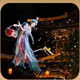
“เมืองโบราณลั่วหยาง”

ชมถ้ำหลงเหมิน มรดกโลกที่เมืองลั่วหยาง • สุสานจีนซีฮ่องเต้ • ศาลเจ้ากวนอู วัดเส้าหลิน + ป่าเจดีย์ + ชมโชว์กังฟู • เมืองโบราณลั่วหยาง • อุทยานหยุนไท่ซาน เจดีย์ห้าพันปี • ถนนวัฒนธรรมต้ากิง • ถนนคนเดินอิสลาม • จัตุรัสหอระฆัง