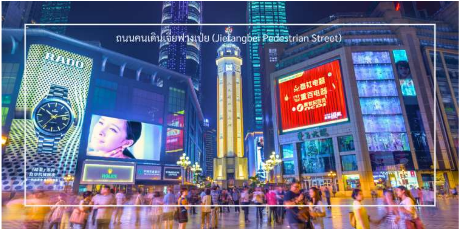
ถนนคนเดินเจียงเป่ย์ (Jiefangbei Pedestrian Street)

และการแสดงต่างๆ ที่ทำให้บรรยากาศน่าสนใจยิ่งขึ้น และยังเต็มไปด้วยร้านค้าแบรนด์เนม ร้านค้าท้องถิ่น และตลาดที่ขายสินค้าต่างๆ เช่น เสื้อผ้า เครื่องประดับ และของที่ระลึก แวะชมร้าน POP MART ร้านดังจากจีน ที่รวมฟิกเกอร์ดีไซน์เก๋และตุ๊กตาน่ารักหลากหลายซีรีส์ยอดนิยม เช่น Molly, Dimoo, Labubu และอีกมากมาย ที่สายสะสมของเล่นไม่ควรพลาด