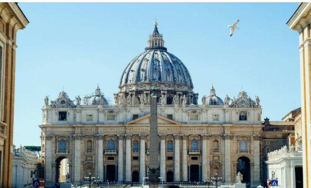
มหาวิหารนักบุญปีเตอร์ ( ST. PETER' BASILICA)

(กรณีมีพิธีด้านใน หรือถ้าหากมีผู้เข้าชมเป็นจำนวนมากจนไม่สามารถเข้าชมได้ทันเวลา ทั้งนี้เพื่อมิให้กระทบต่อกำหนดการท่องเที่ยวอื่นๆ ภายในโปรแกรมทัวร์" อาจจะไม่ได้รับการเข้าชม)