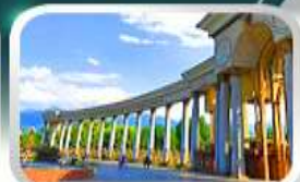
1st President Park