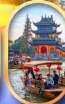
เมืองโบราณจู่เจียเจียว