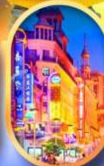
ถนนหนานกิง