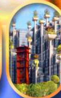
อาคาร 1,000 คัดไม้