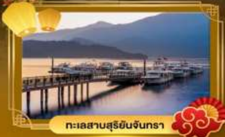
ทะเลสาบสุริยจันทร์