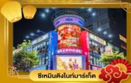
ช้อปปิ้งไนท์มาร์เก็ต