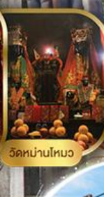
วัดหนานโถว