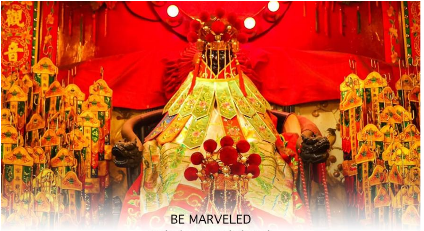
BE MARVELED วัดเจ้าแม่กวนอิมฮวงอ่า (ยิมจิน)

หลังวันตรุษจีน ไป 26 วัน จะเป็นวันเปิดทรัพย์ที่จัดขึ้นในทุกๆปี พิธีนี้จะมีเพียงครั้งปีละครั้งเท่านั้น เป็นวันสำคัญอีกวันที่คน หลัง ไหลมาไหว้ขอพรอย่างไม่ขาดสาย