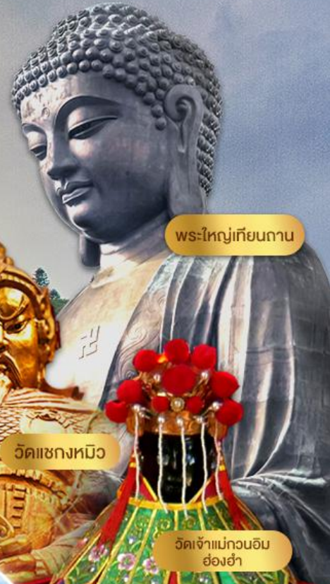
พระใหญ่เทียนถาน