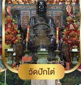
วัดปึกไต้