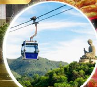
กระเช้าองปิง 360