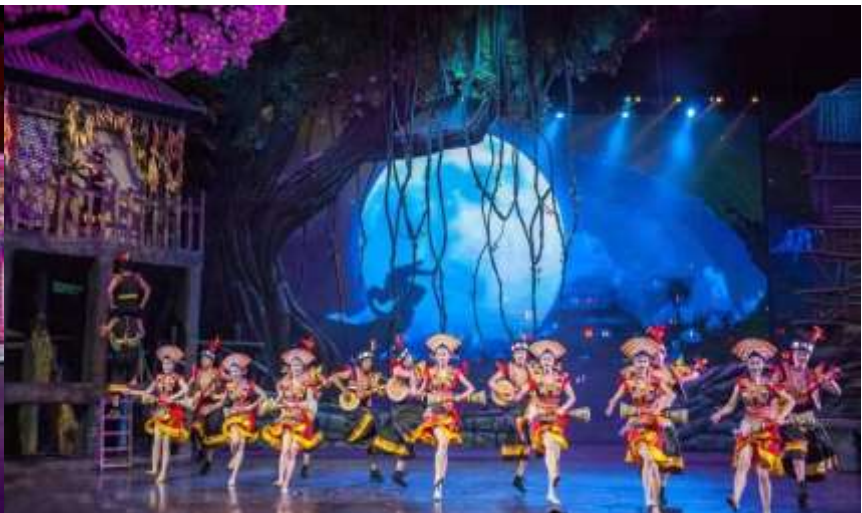
เย็น ๑๐! รับประทานอาหารเย็น (มื้อที่7)

OPTION: โชว์สุนัขจิ้งจอกขาว ราคาท่านละ 400 หยวน