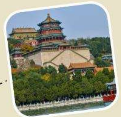
4 พระราชวังฤดูร้อน