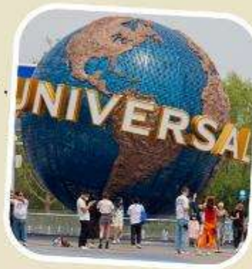
5 UNIVERSAL BEIJING