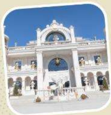
6 POP LAND