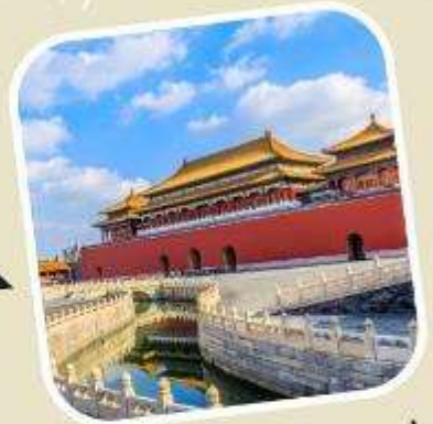
3 พระราชวังต้องห้าม