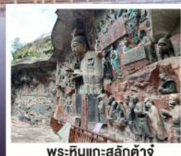
พระหินแกะสลักตัวจู้