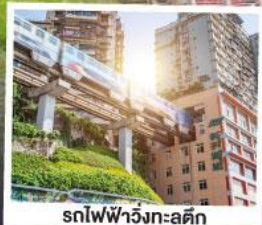
รถไฟฟ้าวงเวียน