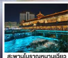
สะพานโบราณหนานเฉียว