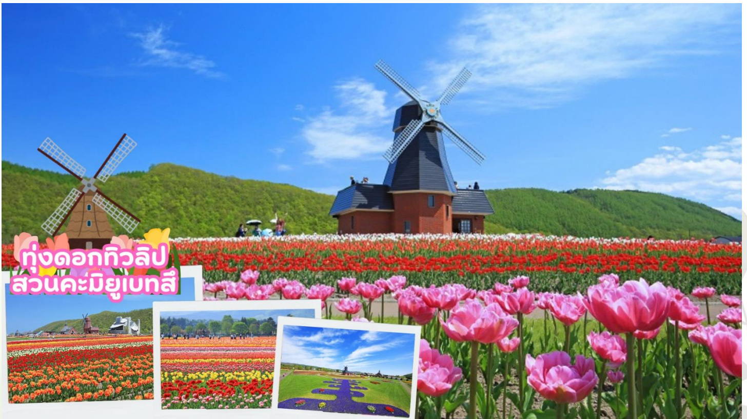
ทุ่งดอกทิวลิป สวนคามิยูเบทสึ

กลางวัน รับประทานอาหารกลางวัน ณ ร้านอาหาร (มื้อที่ 4)