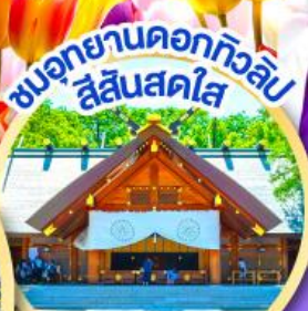
ชมอุทยานดอกทิวลิป สีแสนสดใส