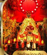
วัดเจ้าแม่กวนอิม ฮ่องซา