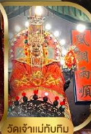
วัดเจ้าแม่กิม