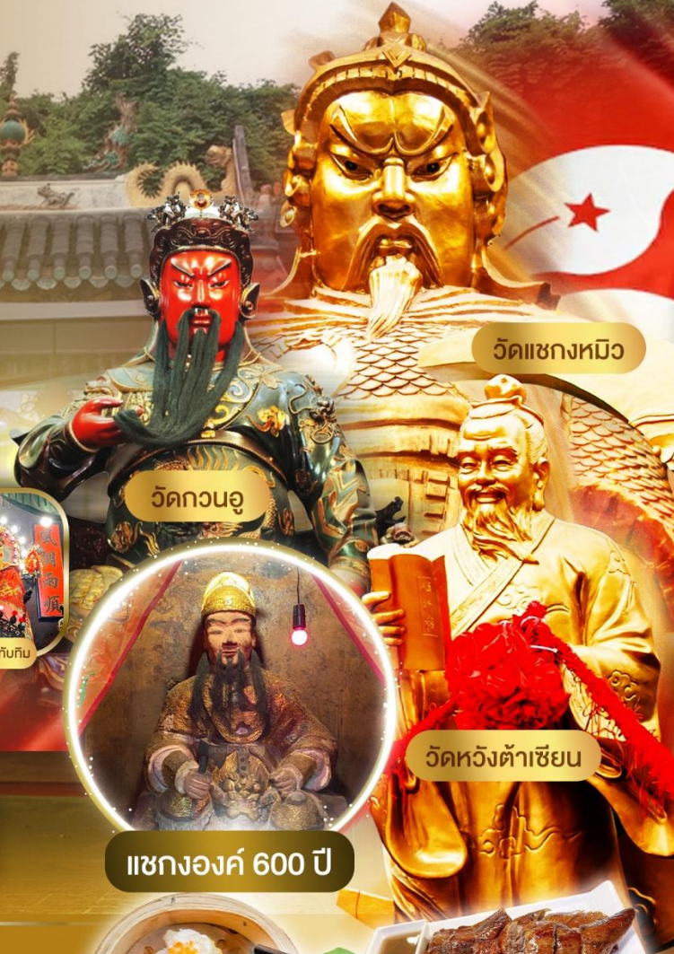
วัดเซกหมิว