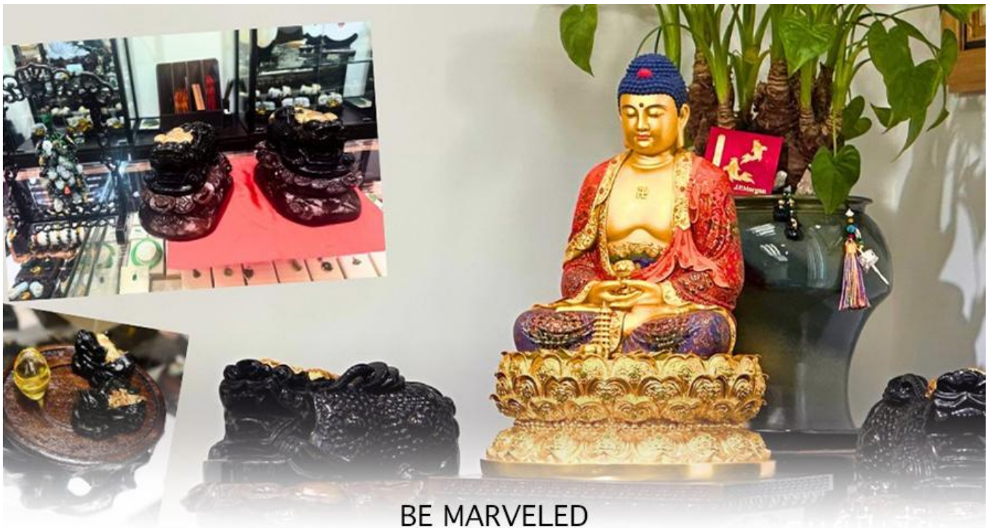
BE MARVELED ศูนยี่เป่เซี่ยะ

นำท่านชม ศูนยี่เป่เซี่ยะ ซึ่งคนจีนนี้ ถือว่าหยกเป็นหิน ที่เป็นตัวแทนของความสวยงามและความบริสุทธิ์มีความเชื่อว่า หยก มงคล ถ้าพกติดตัวไว้จะอายุยืนและสุขภาพดีมีสินค้ำมากมายเกี่ยวกับหยก อาทิ กำไลหยก หรือสัตว์นำโชคอย่างปี่ เสี่ยะ ให้ ท่าน ได้เลือกซื้อเป็นของฝาก, ของที่ระลึก หรือของนำโชคแต่ตัวท่านเอง