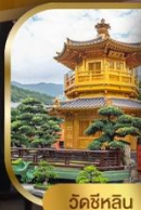
วัดชิลิน