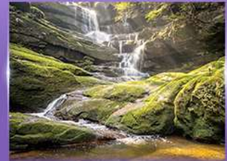
น้ำตกสายทิพย์