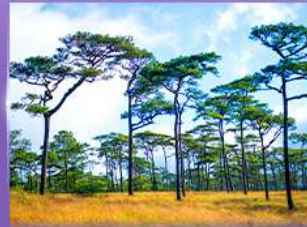
ลานสนกุสอยดาว