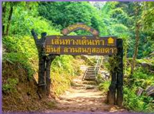
พีช 5 เป็นวัดใจ