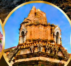
วัดเจดีย์หลวงวรวิหาร