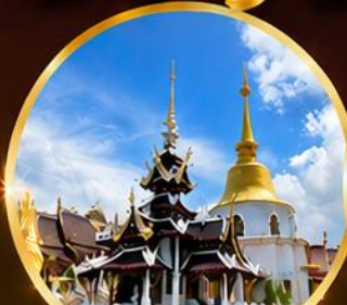
วัดป่าดาราภิรมย์