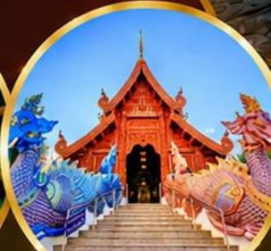
วัดเด่นสะหลีศรีเมืองแกน