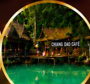
ท่าช้างควา